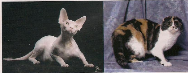
Scottish Fold : CH AMBER SNOW SWEET MARILOU OF LOUPA, Best Scottish SH 2004-2005

Races issues d'une mutation génétique / Breed arising from a genetic mutation